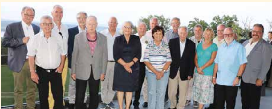
Zahlreiche Clubmitglieder wurden für ihr 40-, 50- oder gar 60-jähriges Clubjubiläum geehrt.